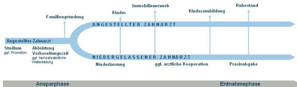
Bild 1: Mögliche Pfade und finanzielle Ziele eines Zahnarztes im Laufe seines Lebens

Immer wieder sollten Sie den im Bild 1 skizzierten Lebenslauf von Beginn an vor Augen halten und auch monetarisieren, also Ihren Zielen und Wünschen einen konkreten Zahlenwert geben.