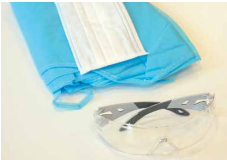
Schutzschürze, Mund- und Nasenschutz sowie die Schutzbrille sind wichtige Begleiter in der Zahnarztpraxis